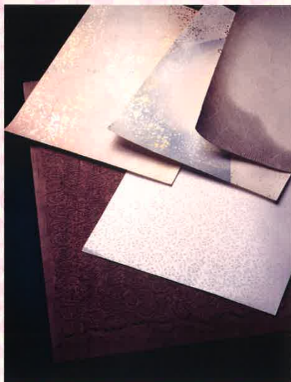
金銀切箔料紙と版木 福田行雄氏作